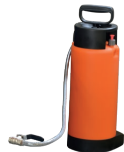
Druckkühlmittel 5l Flascheneinheit PJM-0676-10-00-00-0

Alle Informationen können ohne vorherige Ankündigung geändert werden. 21.07